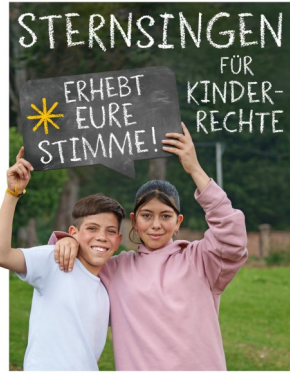
AKTION DREIKÖNIGSSINGEN 20 * C+M+B+25 www.sternsinger.de